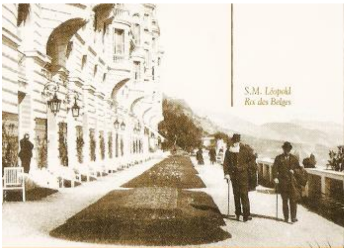
S.M. Léopold Roi des Belges